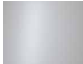
Creamy White (Matte) 1