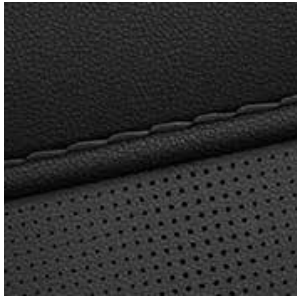
Sitzpolsterung in Leder Schwarz 1

Jetzt Ihren Hyundai SANTA FE konfigurieren.