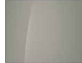
Cyber Sage (Mineraleffekt) 1