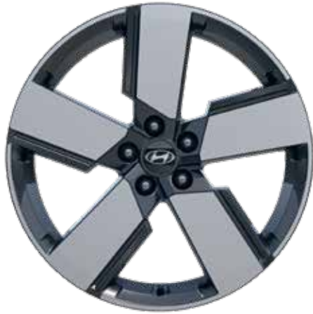
8,5 J x 20-Zoll-Leichtmetallfelgen mit 255/45 R 20 Bereifung 1

Jetzt Ihren Hyundai SANTA FE konfigurieren.