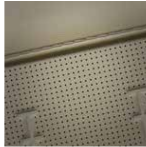
Sitzpolsterung in Leder Beige 1,2,3