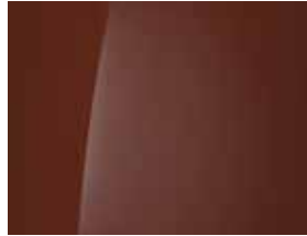
Terracotta Orange (Uni)

Jetzt Ihren Hyundai SANTA FE konfigurieren.