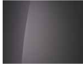
Magnetic Grey (Metallic) 1