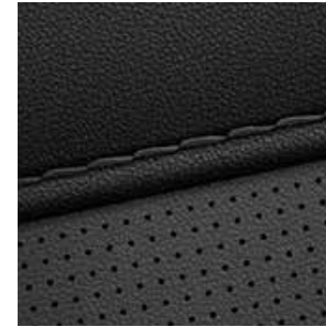
Sitzpolsterung in Nappaleder Schwarz 1