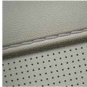
Sitzpolsterung in Leder Grau 1,2