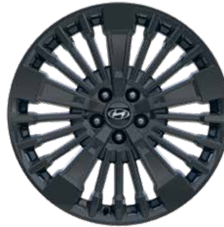
8,5 J x 20-Zoll-Leichtmetallfelgen mit 255/45 R 20 Bereifung 2